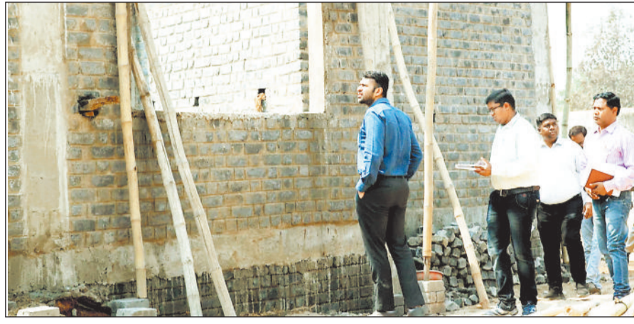
प्रगतिरत है। रायगढ़ ब्लॉक महापल्ली और गोपालपुर, पुसौर के छिछोरउमरिया और गड़उमरिया, घरघोड़ा में छर्रांटंगर और लैलंगा ब्लॉक के भुर्रैयापानी में महतारी सदन का निर्माण पूरा हो चुका है। इसी तरह रायगढ़ के लोईगा, बनौरा, पुसौर के बड़े हर्दी, कोंडातराई, खरसिया के तुरेकेला, बर्रां और धरमजयगढ़

ग्रामीण महिलाओं को स्वावलंबी, आत्मनिर्भर एवं सामाजिक रूप से सशक्त बनाने की दिशा में राज्य शासन द्वारा महत्वपूर्ण पहल की गई है। महतारी सदन में महिलाओं को सामूहिक गतिविधियों, प्रशिक्षण, सामाजिक समरसता एवं आत्मनिर्भरता से जुड़ी योजनाओं में भागीदारी का सशक्त मंच उपलब्ध होगा।